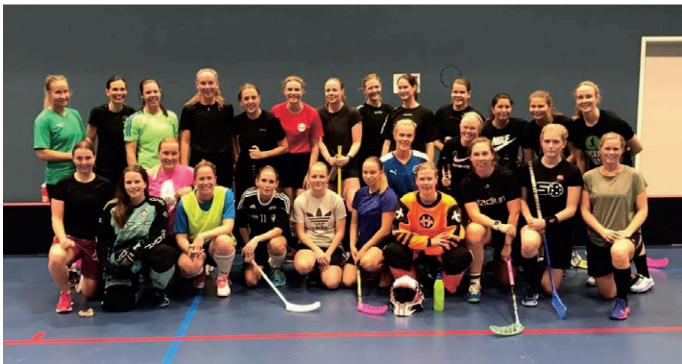
Öppen damträning med 27 spelare på plats i Vikingagårdens sporthall.