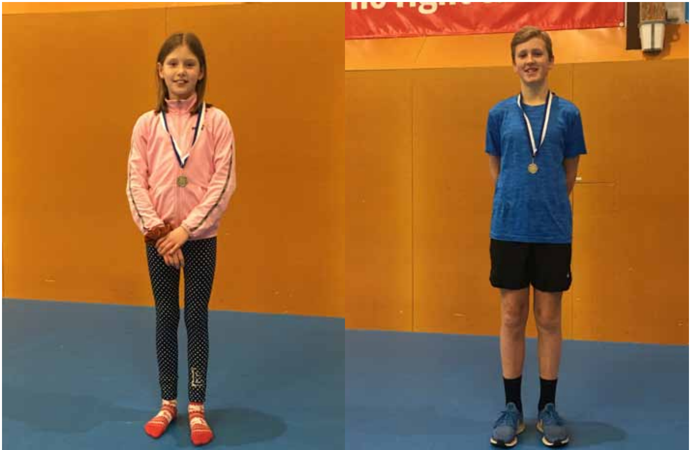
Prisutdelning vid JIK klubbmästerskap i Vikingahallen.