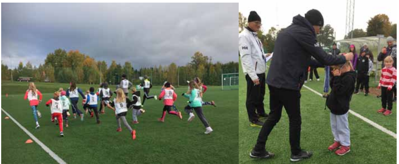
Start och prisutdelning i Janne Terrängen.

Alla tävlingsresultat och statistik finns på www.ifaland.net