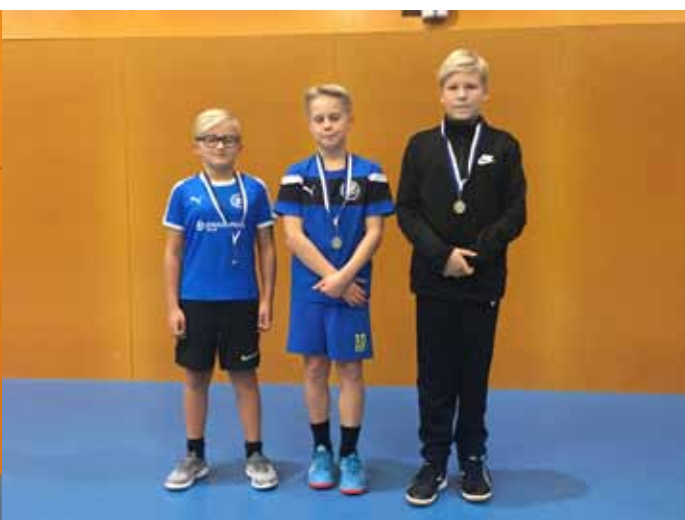
Prisutdelning vid JJK klubbmästerskap i Vikingahallen.